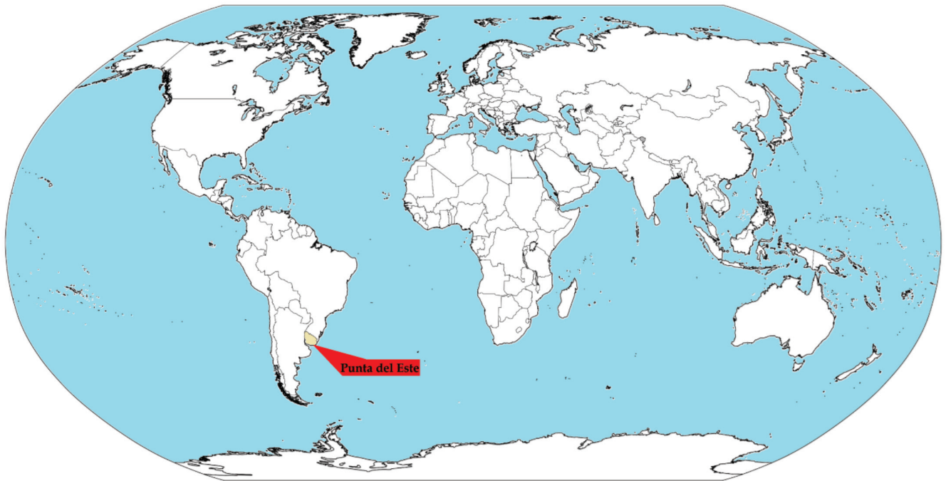
Figura 1. Localización de Punta del Este.